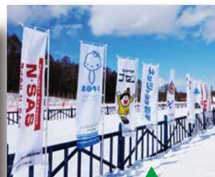
のぼり旗 (レース会場) メイン/プラン A