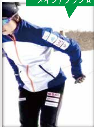
トレーニングジャージ (腕・太もも) メイン/プラン A