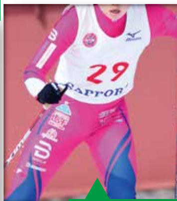
レースウェア (腕・太もも) メイン/プラン A